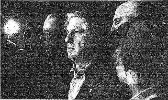
الرئيس اللبناني الاسبق امين الجميل والد بيار الجميل مع مجموعة من انصاره خارج مستشفى الجديدة (الغيب)