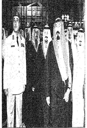
خادم الحرمين لدى استقبال الأمير عبد الجيد