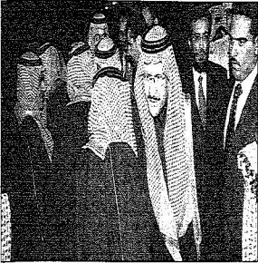
الأمير عبد الجيد يصلح مستقبليه