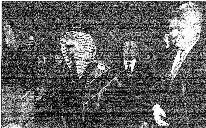
سعو ولي العهد يحيي الحضور في حفل جامعة العلاقات الدولية