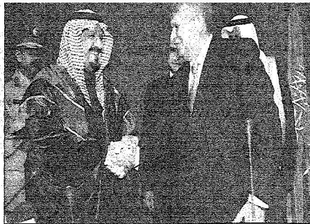
مدير الجامعة يصالح الأمير سلطان في الحفل