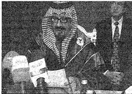
الأمير سلطان بن علي كعكة في حفل جامعة العلاقات الدولية