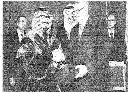
ولي العهد يشتمل الدكتوراه الخيرية من جامعة العلاقات الدولية في موسكو

الأمير سلطان يتبرع بـ ٥٠٠ ألف دولار لدعم أبحاث معهد العلاقات الدولية باللغة العربية