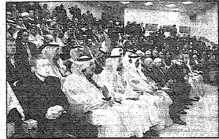
جانب من الوفد المرافق لسمو ولي العهد والحضور لحفل تسليم سموه الدكتوراه الفخرية من جامعة العلاقات الدولية في موسكو

إن منطقة الشرق الأوسط تجتاز مرحلة خطيرة تتعدد فيها الصراعات وتزداد تعقيداً، وكل ذلك يستوجب من بلدينا الصديقين مضاعفة الجهود في سبيل حل المشاكل بالوسائل السلمية والحيلولة دون تفاقمها والعمل على تهدئة الأوضاع وتجنب