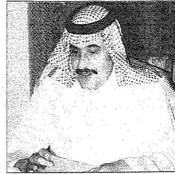
الأمير محمد بن فهد في الاجتماع

سقيا المياه حيث ساهمت بتوزيع ٢٥٠,٠٠٠ عبوة من المياه على مساجد الأميرة العنود والجوامع الكبيرة في الرياض . كما دعت الأنشطة الدعوية والندوات العلمية من خلال طباعة الكتب