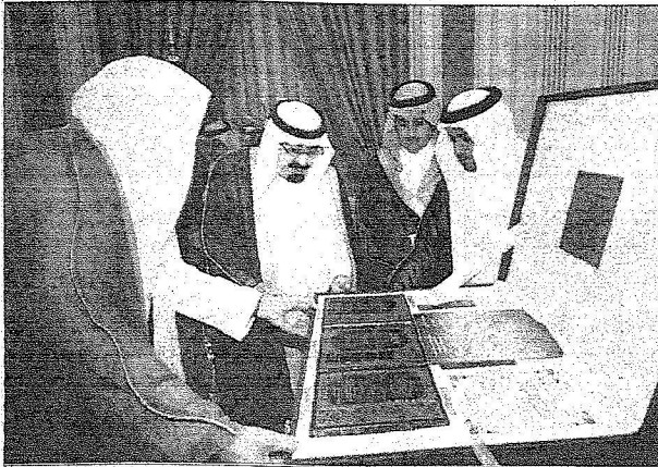
خادم الحرمين الشريفين يتسلم هدية تذكارية من د. إبراهيم أبو عياد رئيس جهاز الإرشاد والتوجيه في الحرس الوطني.