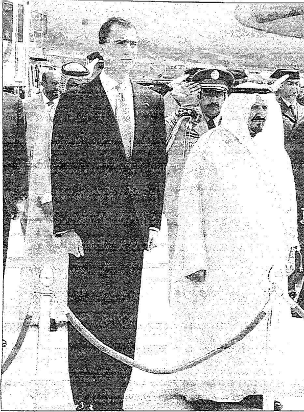
الأمير سلطان وولي عهد إسبانيا بفغان على منصة الشرف

وكان في مقدمة مستقبلي سموه لدى ووضوله مطار مدريد سمو ولي العهد الإسباني الأمير فيليب دي بوربون وعدد من كبار المسؤولين الإسبان وسمو الأمير سعود بن نايف سفير خادم الحرمين الشريفين لدى إسبانيا وأعضاء السفارة السعودية بمadrid حيث أجريت لسموه مراسم استقبال رسمية.