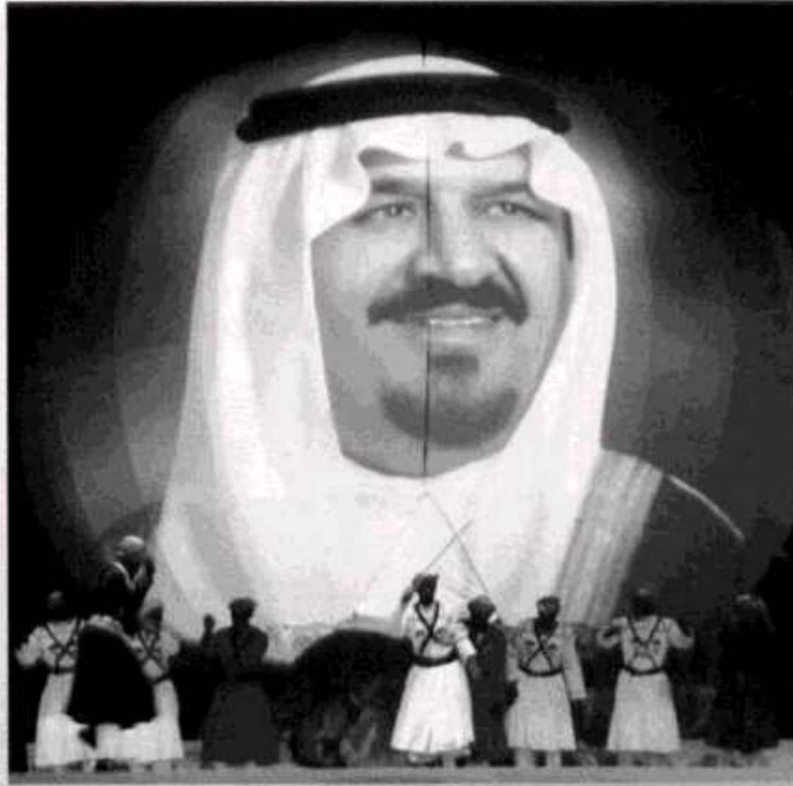
ولي العهد... خلال الأمن والخير والوفاء