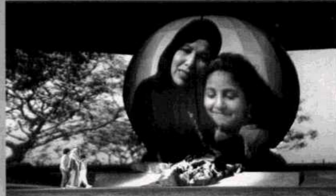
أسر الشهداء.. الوطن يكرم أبنائه الأوفياء