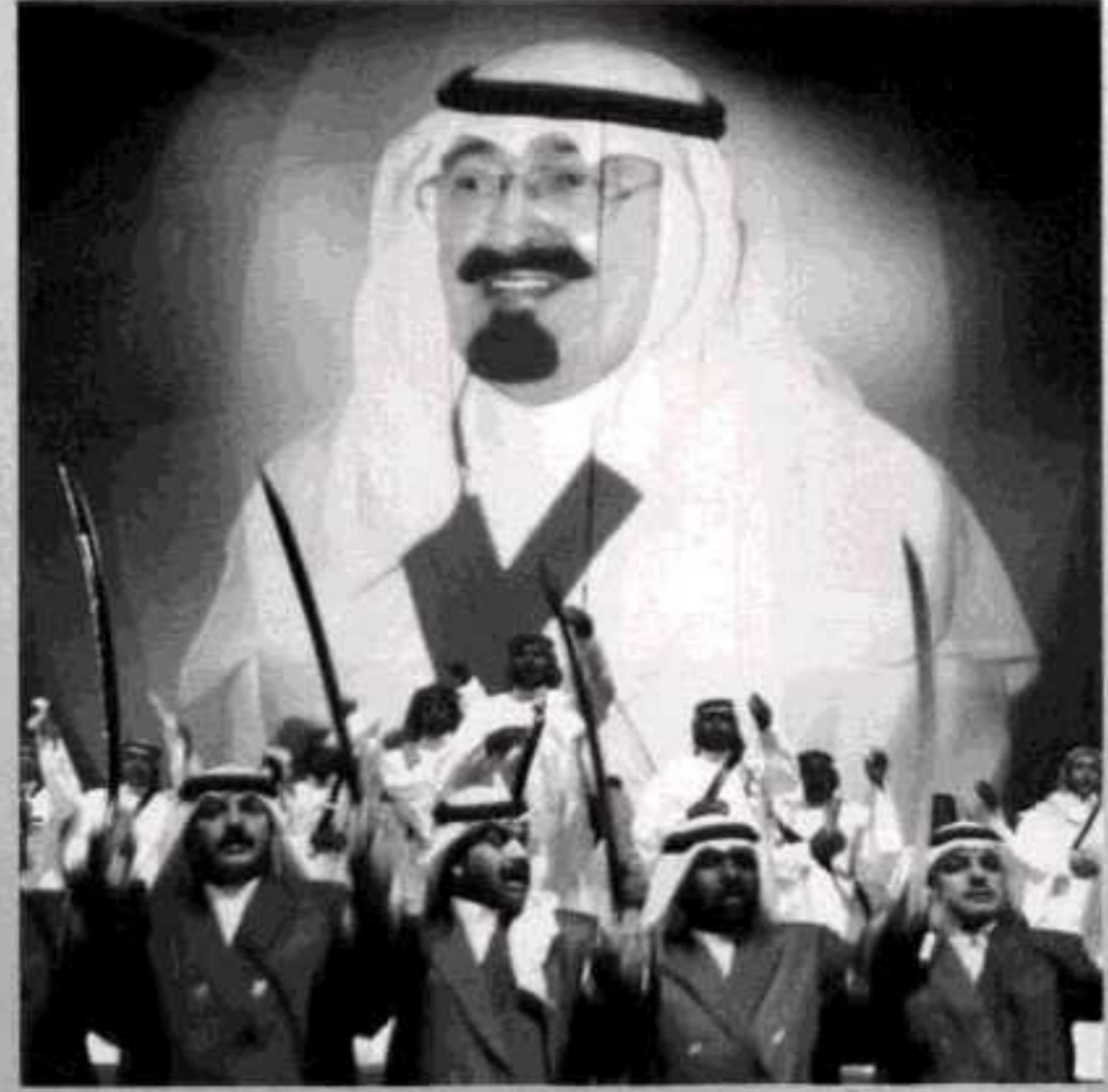
مالماً يا مليكتنا.. في القلب والعين وحامي بلادنا العزيزة

بعنوان «أرض المحبة والسلام، من كلمات الشاعر خلف محمد الخلف وألحان الفنان رابح صقر سيناريو وحوار علاء حمزة ورواية وإخراج قطيس بقنة، وأدى الأوبريت الفنانون محمد عبده وعبادي الجوهر وخالد عبدالرحمن وعباس إبراهيم بمشاركة فرق الفنون الشعبية السعودية. عقب ذلك تشرف بالسلام على خادم الحرمين الشريفين المشاركون في الأوبريت من فنانيين وملحن ومخرج ومطاقم العمل.