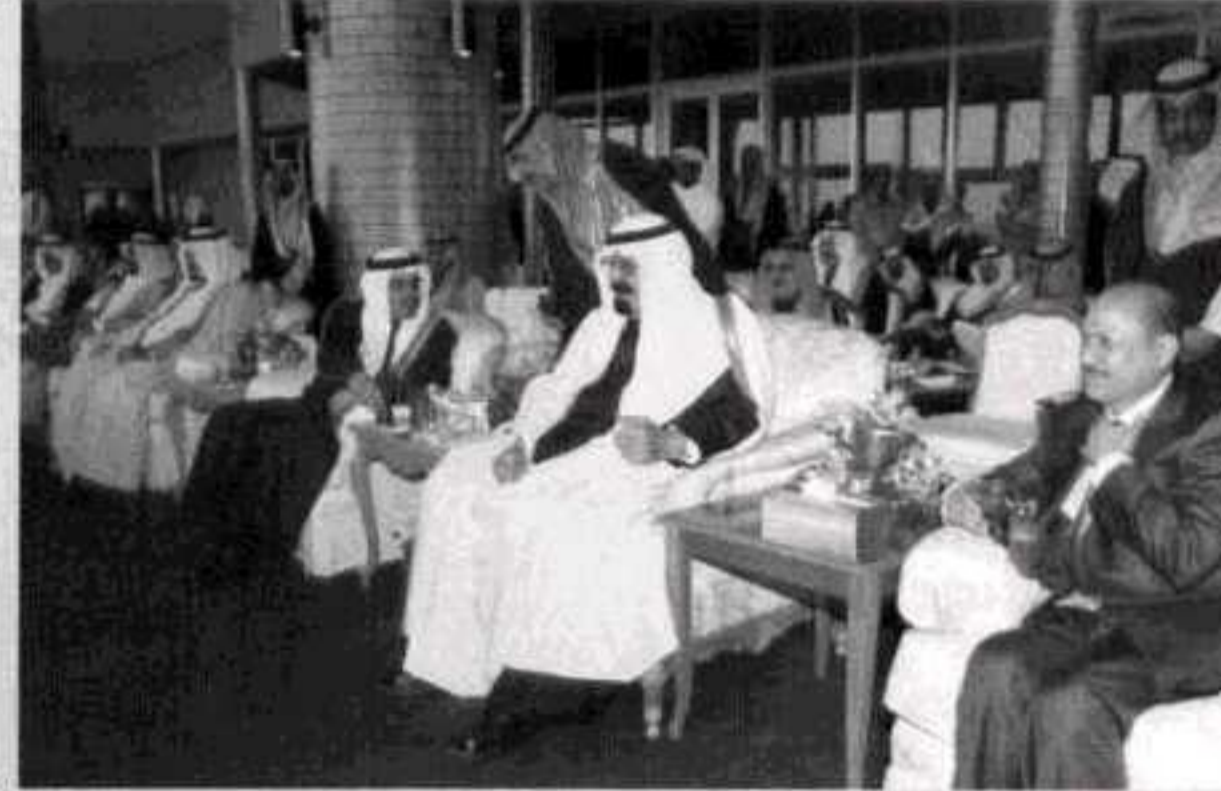
التاريخ يمون الأشقاء يستحق التسجيل

أرض للعطاء والنماء وملتقى للثقافة والتراث..