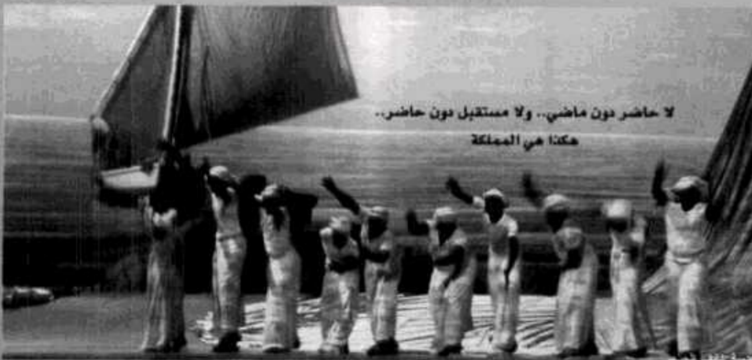
لا حاضر دون ماضي.. ولا مستقبل دون حاضر.. هكذا هي المملكة