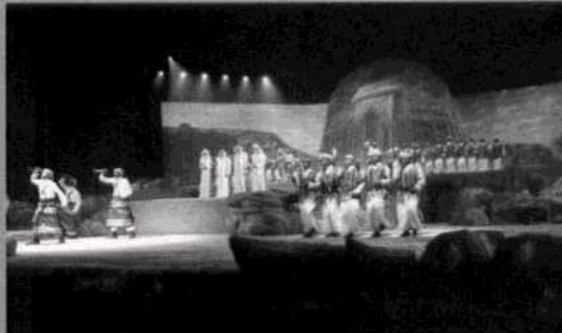
من قلب النور.. وطن ورجال وتاريخ تحكيه الركبان