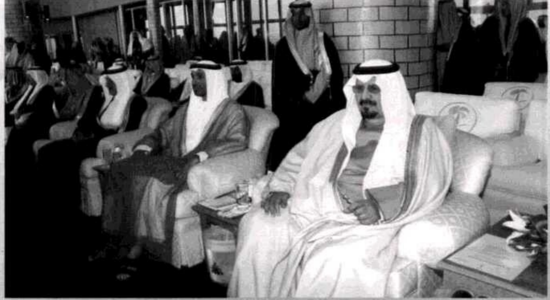
متابعة ولي العهد للفعاليات... اهتمام وتقدير

د. هاشم نيابة عن الضيوف: المهرجان مخزون ثقافي وموروث حضاري