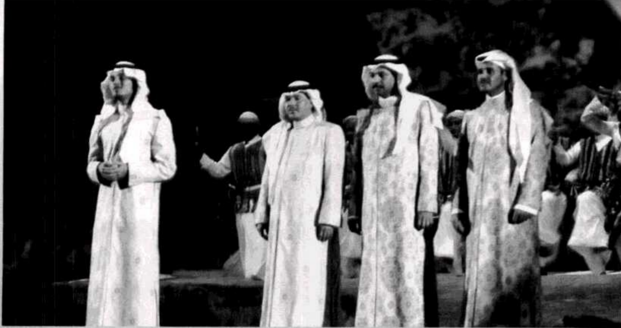
فنانونا يشدون برؤس المحبة والسلام