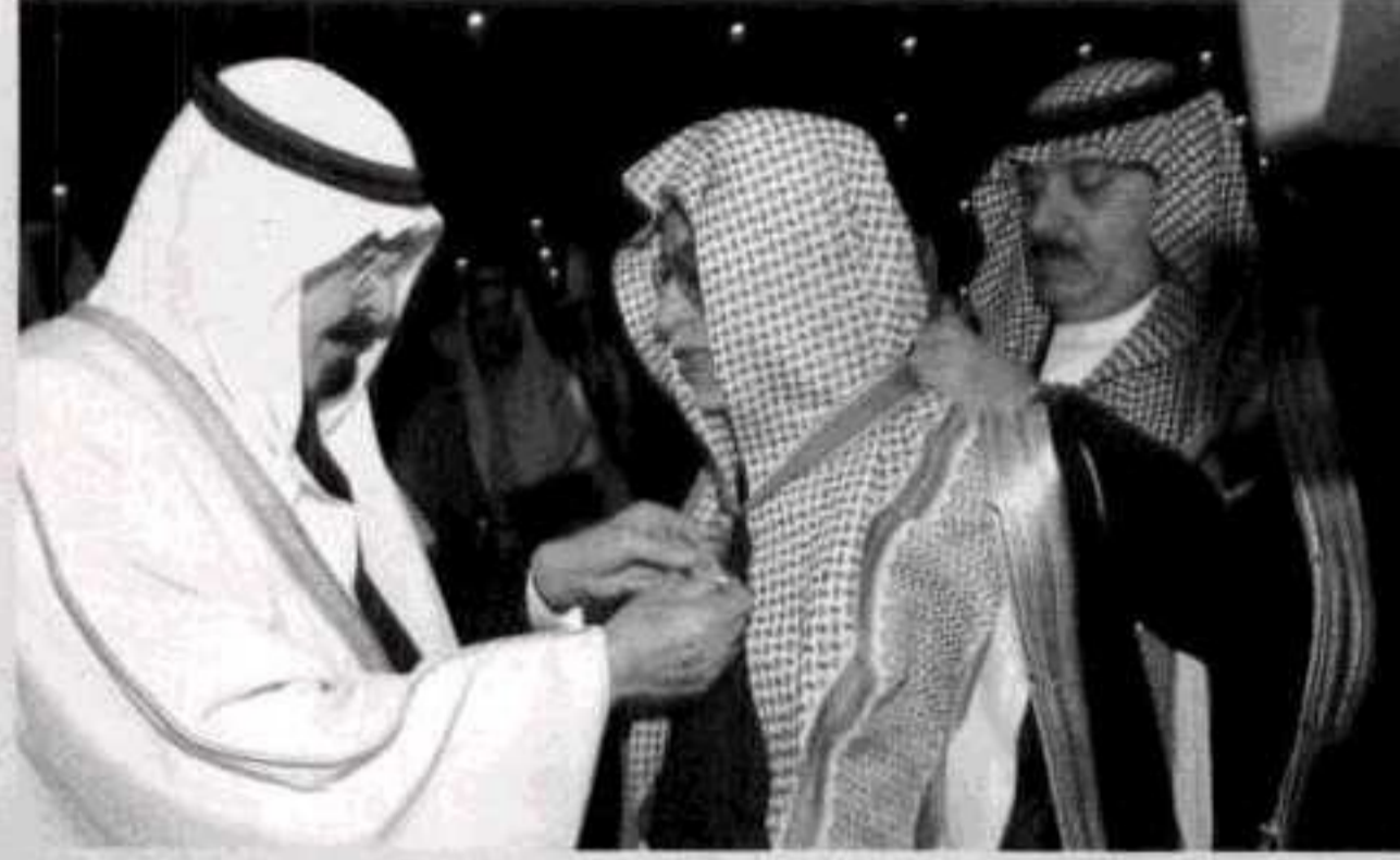
تكريم الثقافة.. ذاكرة الأمة في قلب الملك

الشريفيين الملك عبدالله بن عبدالعزيز آل سعود بتكريم الشخصية السعودية الثقافية لهذا العام وهو الأديب الدكتور حسن بن فهد الهويمل بوسام الملك عبدالعزيز من الدرجة الأولى.