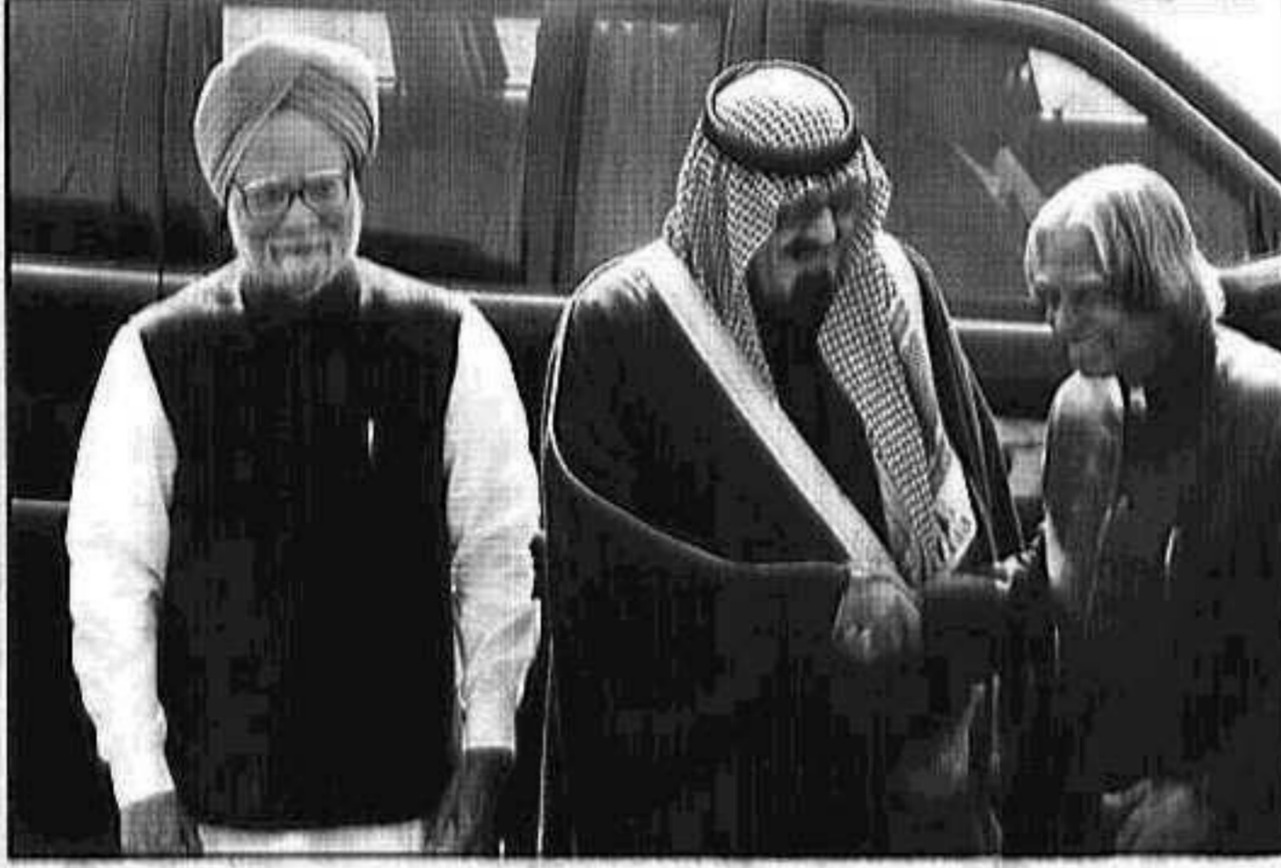
الملك عبدالله يصافح الرئيس الهندي والي جانبه رئيس الوزراء الهندي