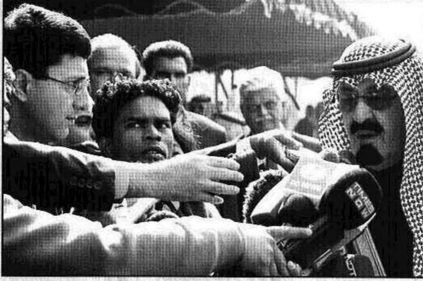
خادم الحرمين في حديثه لوسائل الإعلام الهندية والعالمية

التجارية القديمة والفعالة بين البلدين - ووصف معالي وزير شؤون الشركات بريم غوتبا زيارة خادم الحرمين الشريفين بأنها تحرك إيجابي من الحكومة الهندية ومثال جيد على السياسة الخارجية الإيجابية للحكومة الهندية الراهنة . ووصف النائب في البرلمان عن حزب المؤتمر (راشد ألفي) زيارة خادم الحرمين الشريفين بأنها دافع معنوي للهنود الذين يعملون في المملكة، وفرصة لفتح آفاق تجارية أرحب بين البلدين، وقال (كمال اختر) عضو البرلمان عن حزب (ساماجوادي) إنه بعد مرور وقت طويل اتخذ قرار صائب في اختيار الضيف الرئيسي في يوم الجمهورية، بينما وصف (ساشين بيلوت) عضو البرلمان عن حزب المؤتمر زيارة الملك عبدالله بأنها بداية فصل جديد في العلاقات بين الهند والمملكة. ودعت رئيسة وزراء ولاية (أثار براديش) الهندية السابقة الملك عبدالله لزيارة الهند بشكل دوري وأن يقوم رئيس الوزراء الهندي بزيارات مماثلة، وقالت إن هذا أمر ضروري في هذا العالم الذي يتغير بسرعة.