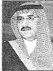
محمد بن نايف

فندق قصر الرياض تمهيداً لنقلهم بواسطة حافلات الى الحائر للقاء ابائها مؤكداً ان امكانية الزيارة ستكون لاقرب الاقربين للعائدين كالاويين والزوجة والابناء والاخوة والاعمام. وكان صاحب السمو الملكي الامير نايف بن عبدالعزيز وزير الداخلية قد أكد في معرض رده على سؤال «عكاظ» يوم الاحد الماضي حول كيفية نجاح وزارة الداخلية في احتواء العائدين من جوانتانامو وصهرهم في المجتمع مجدداً ان ذلك تم بجهود مكثفة والتأكد على هؤلاء اهتمام الدولة باسراهم فترة