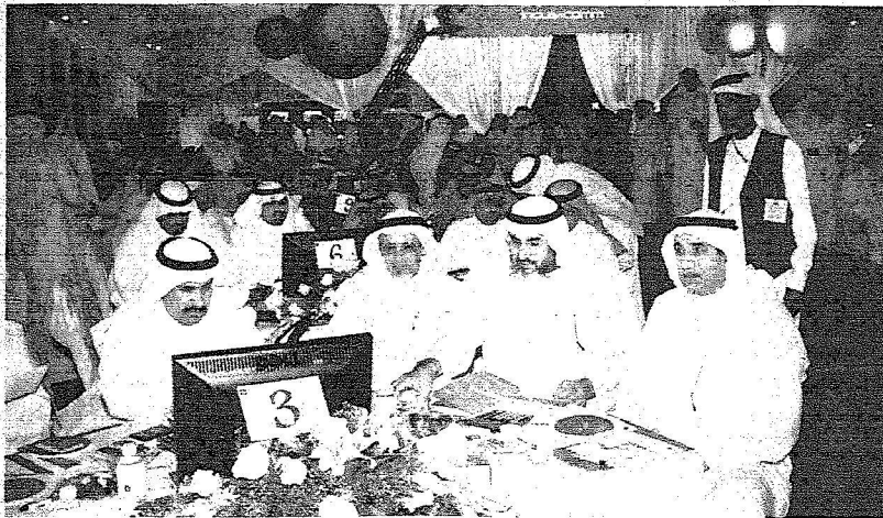
العقاريون استخدموا التقنية الحديثة في المزاد