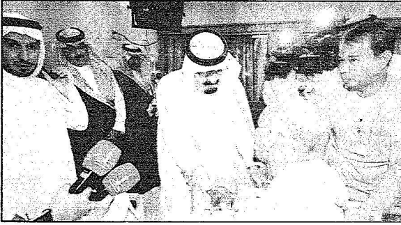
ويزور امير الفوج السادس للحرس الوطني