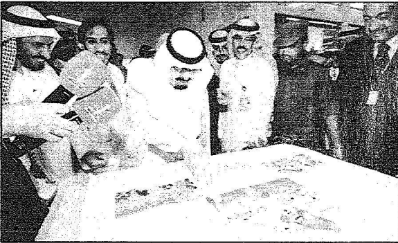
المليك يتفضل بتقميم الحلوى احتفالاً بالنجم