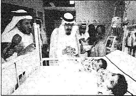
المليك في زيارة أبوية للتوائم السياميين

الحرس الوطني المساعد للشؤون العسكرية ومعالي رئيس المراسم الملكية الأستاذ محمد بن عبدالرحمن الطينيطي ومعالي مستشار خادم الحرمين الشريفين الأستاذ عبدالحسن بن عبدالعزيز التوجري.