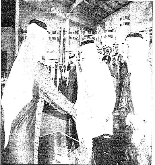
البر، نورة، بكارة، طالب، المشرف، طين

لدعم مسيرة 47 عاما من تعليم البنات بالمنطقة