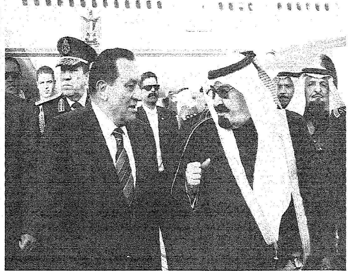
خادم الحرمين الشريفين خلال استقباله الرئيس المصري في مطار قاعدة الرياض الجوية أمس.