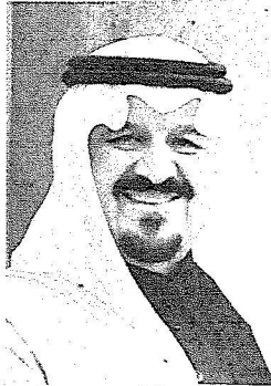
سمن ولي العهد