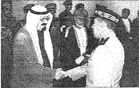
المليك يصافح كبار مسئبليله من مذبنين وعسكربين