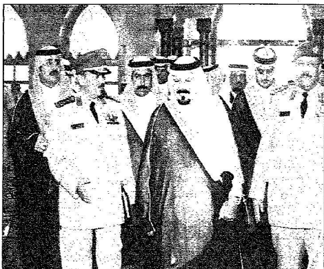
ولي العهد ابنه مفخرة جده في طريقه لنجرا