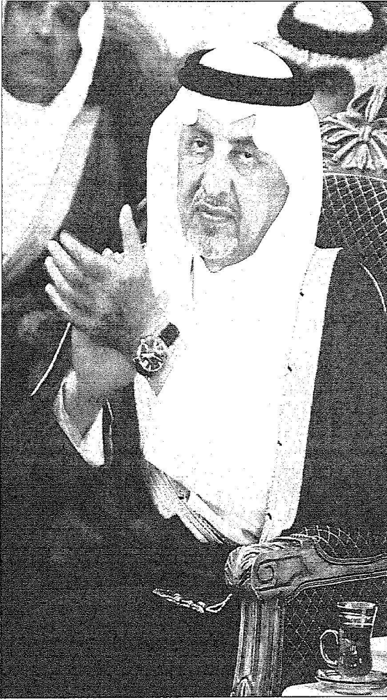
أمير منطقة مكة المكرمة يطلع على عرض مشروع جسر الجمرات أسس.

محمد العويزي، عبد الرحمن الشمراني - المشاعر المقدسة