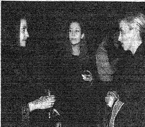
الطالبات لبسن العباوات ونقشن الحناء على معلمتهن