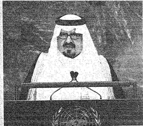
الملك عبدالله بن عبدالعزيز دشّن مشروع المدينة الصناعية العملاقة في إقليم النكا تقدر تكاليفه بـ ١٠ مليارات ريال ، وسيوفر نحو ١٠ ألف وظيفة ، ويهدد واحداً من أكبر المشروعات في منطقة الشرق الأوسط