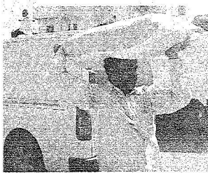
الحصول على كيس دقيق مهمة صعبة