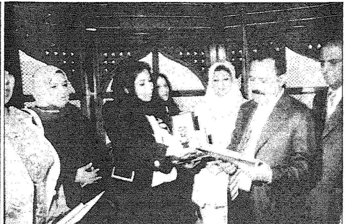
الرئيس اليمني علي عبد الله صالح لدى إستقباله الوفد السعودي من الجمعية العربية لمناهضة الارهاب ودعم ضحاياه

انطلاقاً من اليمن بدأنا زياراتنا لرؤساء وزعماء الدول العربية