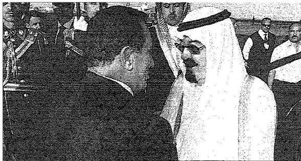
الرئيس مبارك يستقبل خادم الحرمين