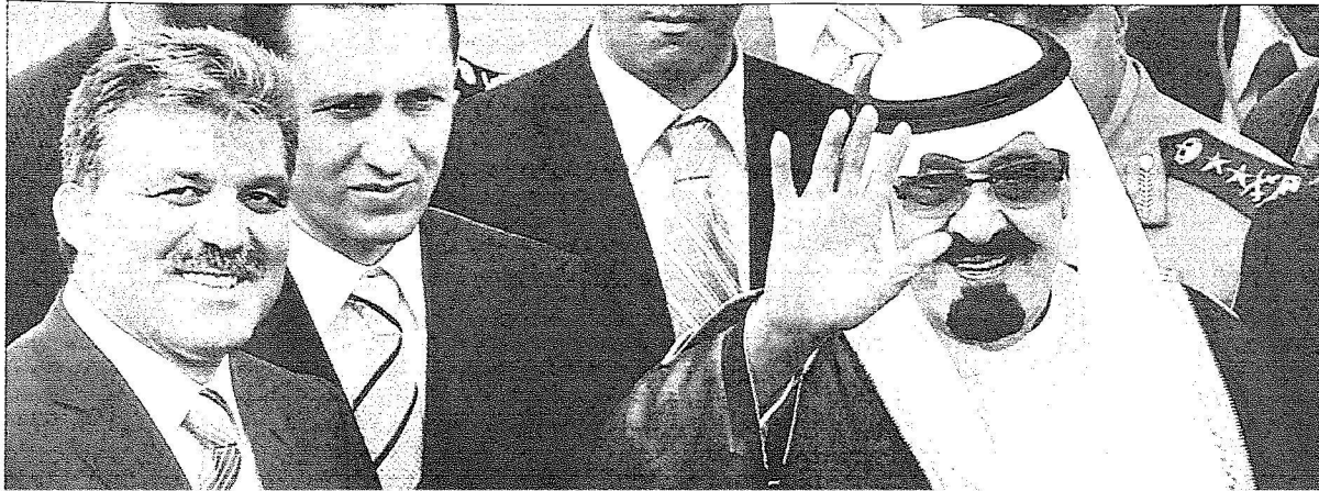
خادم الحرمين الشريفين يلوح لمستقبله لدى وصوله انقرة أمس

عقد خادم الحرمين الشريفين الملك عبدالله بن عبدالعزيز والرئيس التركي احمد نجت سيزار امس جلسة مباحثات رسمية تناول خلالها سبل تفعيل العلاقات الثنائية في جميع المجالات في اطار برامج الشراكة الاستراتيجية. كما تناولت المباحثات مجمل القضايا الاقليمية والدولية وخصوصا العدوان الاسرائيلي على لبنان والاراضي الفلسطينية.