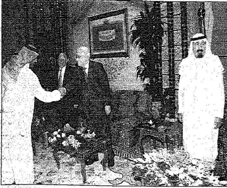
و يستقبل أبو مازن