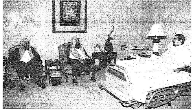
جانب من الزيارة