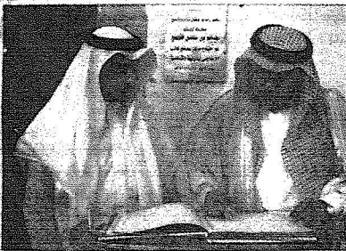
وكيل وزارة الحج يسجل كلمته في سجل الزوار

بيت الله الحرام فنحن نظل نحتاج للكثير والكثير وما شاهدناه من خدمات مميزة قام بها مكتب الخدمة الميدانية رقم(١٢)والصالح لمؤسسة مطوفي حجاج جنوب آسيا أمر يثلج الصدر ويرزق الخاطر وقدم وكيل وزارة الحج شكره وتقديره لرئيس مكتب الخدمة الميدانية رقم(١٢) ووالده ولكافة القائمين عليه مشيراً بأن جهود المكتب في تدشين