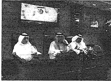
جانِب من الحفل