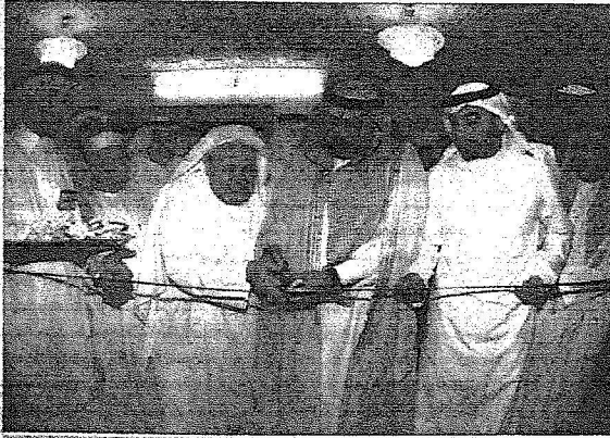
افتتاح المركز الإعلامي