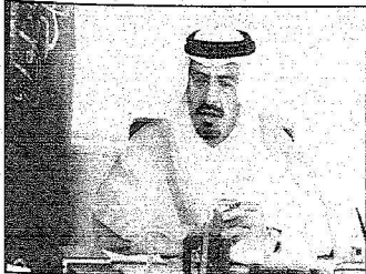
مسو امير حائل

ملتقى الخطة الزراعي ينطلق اليوم بنسخته الرابعة