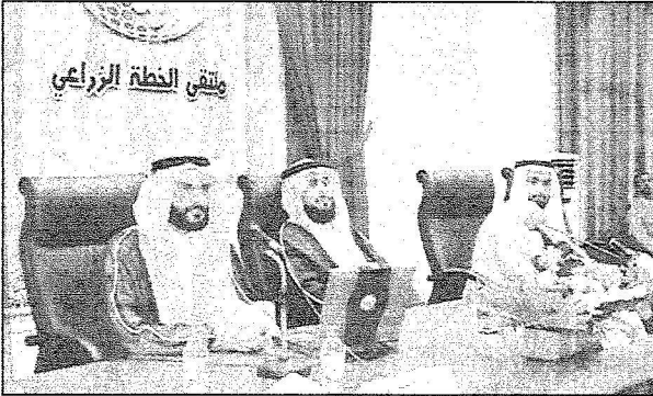
إحدى جلسات الملتقى في نسخته الثالثة العام الماضي