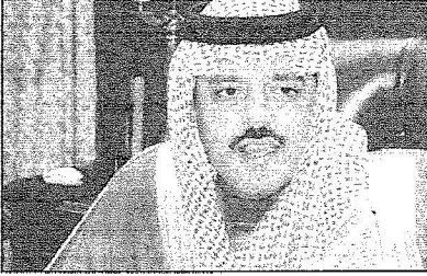
سمو نائب أمير حائل

رئيسياً في معظم جوانب التنمية والتطوير. وقال سموه عن المجال الزراعي نحن بحاجة للعديد من اللقاءات والملتقيات الزراعية التي تكون عاملاً مساعداً نحو تكوين صورة واضحة لعالم مستقبل هذا القطاع الاقتصادي الهام.