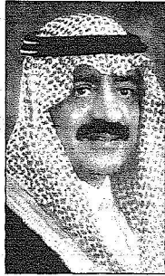
الأمير مقرن بن عبدالعزيز

يرعى خادم الحرمين الشريفين الملك عبدالله بن عبدالعزيز - حفظه الله - المؤتمر العالمي لتقنية المعلومات والأمن الوطني الذي تنظمه رئاسة الاستخبارات العامة خلال الفترة من 22-25 شوال 1428هـ الموافق 3-6 نوفمبر 2007م بالرياض.