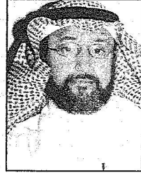
الرشد : آلاف طن من التمور سنويًا لبرنامج الغذاء العالمي

حملة الإغاثة السعودية لأشقاء في باكستان مستمرة حتى الآن..