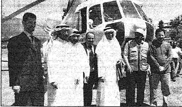
المقربيط والرشد ومسؤولو الإغاثة السعودية في جولة بكمشير

لبنكستان. وواصل المقربيط حديثة لـ «الرياض»، قائلًا إن العمل الإغاثي يحتاج إلى تواجد في الميدان لتلبية احتياجات المتضررين والبحث عن سبل المساعدات سواء عبر التعاون المباشر أو التثاقف بين الحكومات أو عبر المنظمات الغذائية حتى يكون هناك تناسق ولترتيب المشاريع وإعادة الاعمار والشق الحكومية من العمل الاغاثي هو ما تشوالة وزارة المالية ويوجد ممثلوها في الميدان لهذا الغرض. وقال ان وزارة المالية وتتوجهات من خادم الحرمين الشريفين