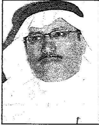
١٨ عاماً قدمها المملكة مساعدات لأكثر من ٥٠ دولة

تسهيل الإجراءات وتذليل الصعاب من أجل تقديم العمل الإغاثي المتكامل والذي يحتاج سرعة الإنقاذ لفتح حسابات مالية لتسريع العمل الإغاثي السعودي وتعتبر وزارة المالية إحدى الجهات المشاركة بالإغاثة السعودية ويتم التنسيق مع السفارة بهذا الخصوص وهناك توجهات بالاستمرار في العمل الإغاثي الفوري ولمسنا هنا في باكستان توجهاً بالاهتمام بالإعمار من قبل الحكومة الباكستانية وهذا يدكرنا بمساهمة المملكة بتقديم ٥٠٠ مليون دولار للمساهمة في الإعمار والتي أمر بها خادم الحرمين الشريفين في حينه وقام ممثلو الصندوق السعودي للتنمية بعمل الترتيبات لتمويل المشاريع والتباحث حول تحديد فوضيه المشاريع من خلال الاتصالات والزيارات الخارجية حيث إن المملكة من ضمن الدول المانحة