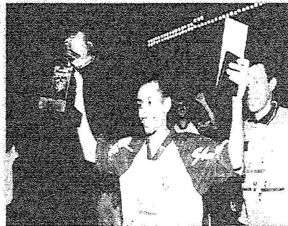
الاسطورة سامي الجابر يحتفل بلقبه الملكي في الأسيوية