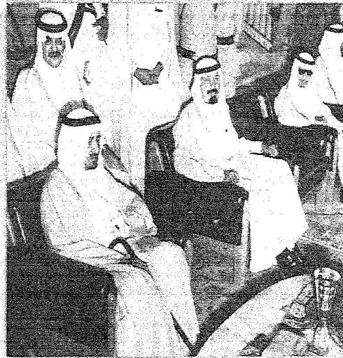
الأمير عبدالله بن عبدالعزيز يتابع مع الملك خالد (رحمه الله) مباراة الهلال والأهلي في نهائي كأس الملك (١-١٣٩٧هـ) ويظهر إلى جانب سموه الأمير سعود بن فهد والريس الهلال السابق عبدالله بن سعد (رحمهما الله)

إدارة بندر بن محمد أكدت التفوق بالأزرقه قارباً أربع سنوات بثلاث بطولات