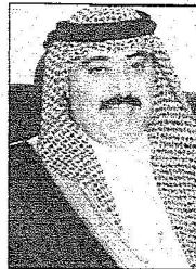
الأمير متعب بن عبدالله