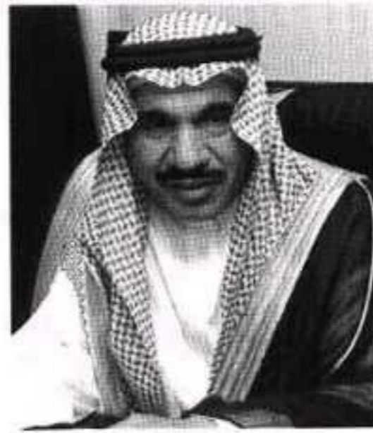
سليمان الخضير محافظ البكيرية

ومن مساهمات الأهالي على سبيل الذكر لا الحصر