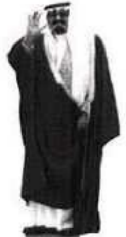
ملك الوفاء... مع قيم الملاء