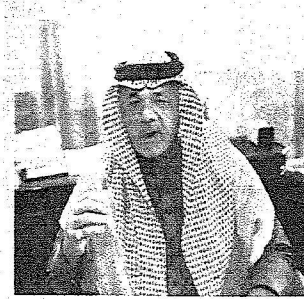
□ تصوير - فحي كالي