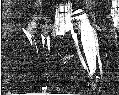
حديث باسم بين خادم الحرمين والنائبين غول وواسر