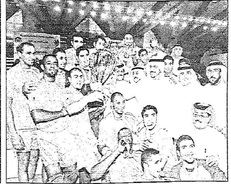
فرقة نجوم اخضر اليد بالكأس