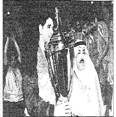
الطرود وعتاف آل سعيد يرفعان الكاس

الطرود : دعم الرئيس العام ونائبه سر الإنجاز