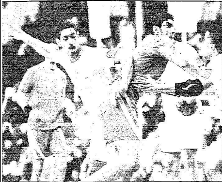
من لقاء الاخضر والبحرين