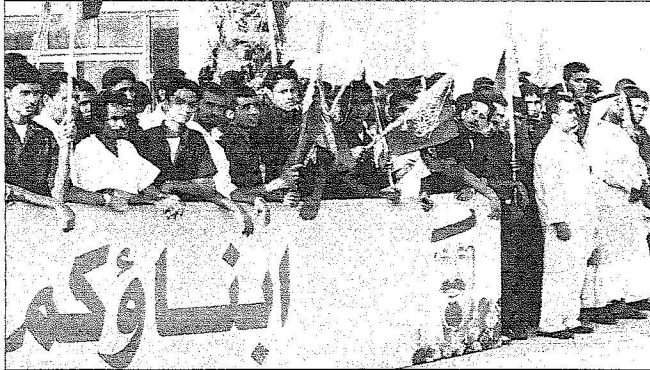
لافتات ومظاهر ترحيبية لخادم الحرمين الشريفين في جازان أمس.