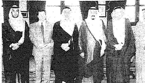
الامير سلمان لدى استقباله د. عمر فؤاد