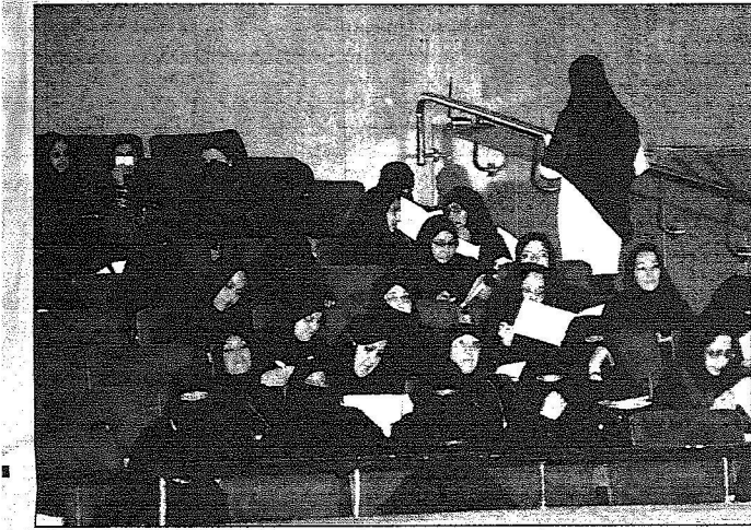
□ تصوير - حسين النوسري:

للجمعية الخليجية لطب الأسنان، وتشجيع البحث العلمي داخل المملكة وإعطاء الأولوية للبرامج الوقائية، وتفعيل دور المناطق في استقطاب أعضاء جدد.