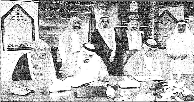
وزير التعليم العالي خلال توقيع الاتفاقية وبجواره مدير الجامعة .