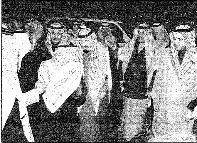
استقبال خادم الحرمين الشريفين لمحافظة رماح ورؤساء الدوائر الحكومية ورؤساء مراكز المحافظة وجمعاً من المواطنين

وكان خادم الحرمين الشريفين قد غادر بحفظ الله ورعايته الرياض عصر امس الاول متوجهاً إلى روضة خريم لقضاء بعض الوقت. وكان في وداعه أبده الله لدى مغادرته قصر الجمامة صاحب السمو الملكي الأمير سلطان بن عبدالعزيز آل سعود ولي العهد نائب رئيس مجلس الوزراء وزير الدفاع والطيران والمفتش العام وصاحب السمو الملكي الأمير فيصل بن عبدالله بن عبدالعزيز رئيس جمعية الجلال الأحمر السعودي وعدد من المسؤولين.