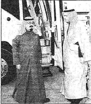
وصوله لروضة خريم