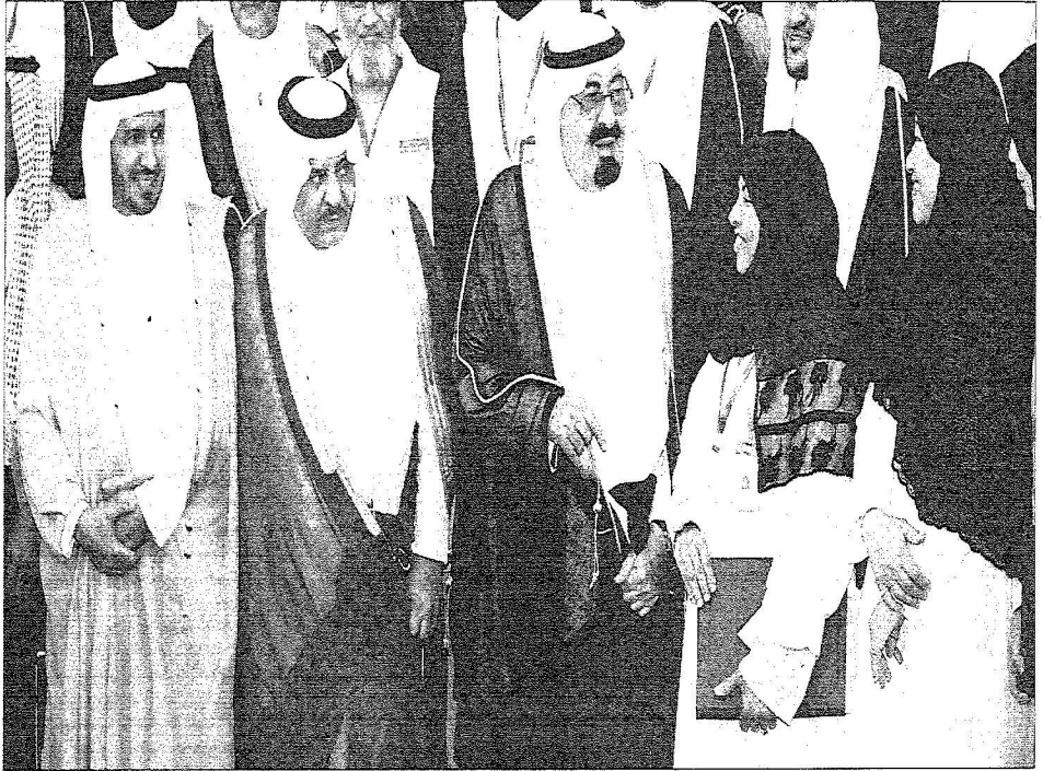
خادم الحرمين الشريفين متحدثاً إلى منسوبي مدينة الملك عبد الله الطبية في منى أيس. ويبدو الثاني لثاني وزير الصحة، تصوير: عمرو سلام، عكاف.