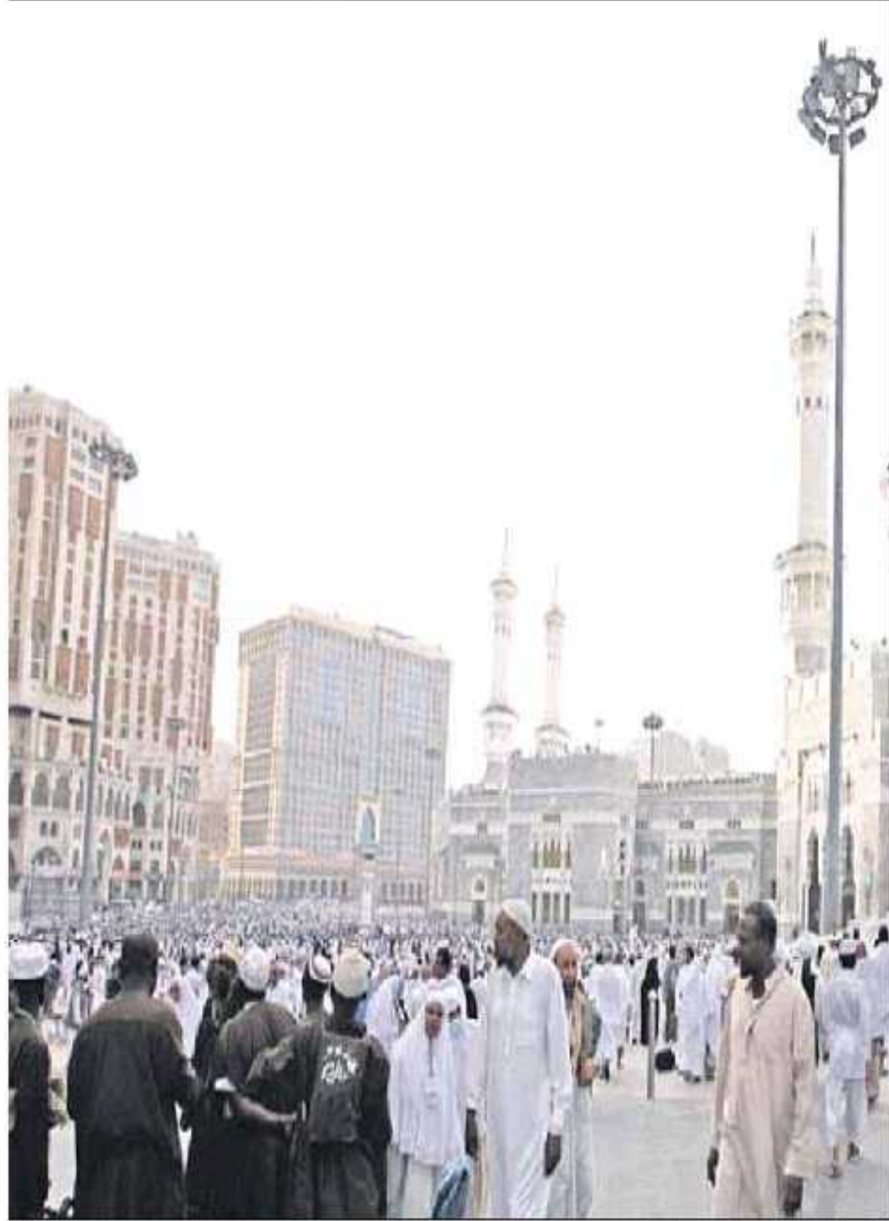
حجاج بيت الله الحرام مفادين مكة