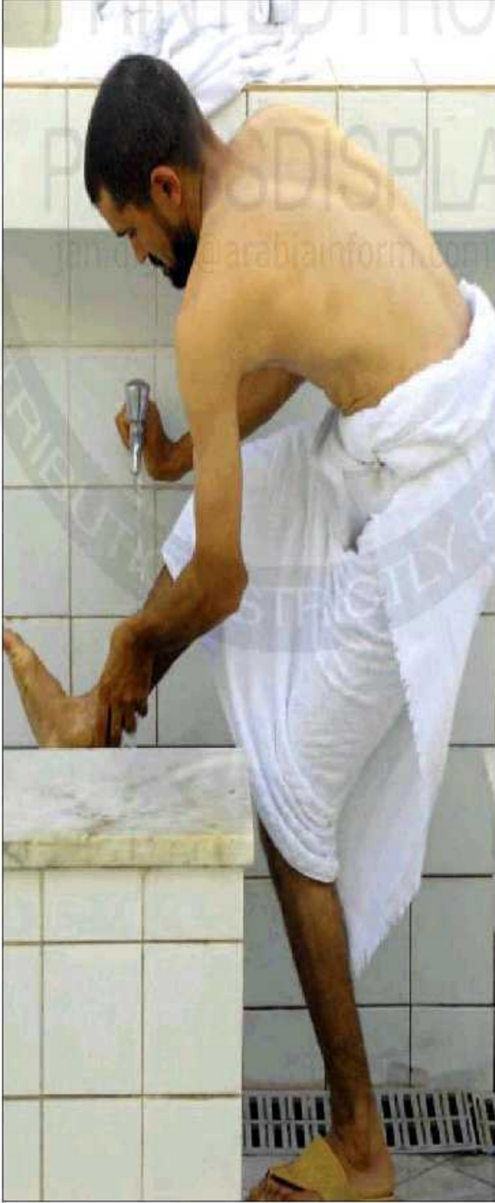
حجاج يتروءنأ تأعبيا للصلاة (أبدا)