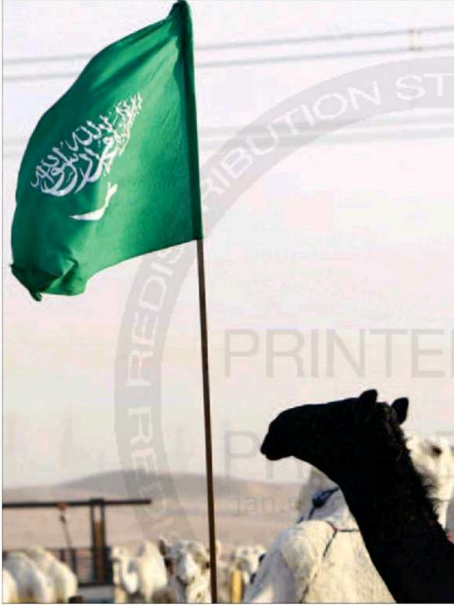
جمال في سوق للمواشي بالقرب من العاصمة الرياض أمس

وتشرفوا بزيارة المسجد النبوي الشريف والصلاة فيه بلغ 863071 حاجا وتم ولله الحمد استكمال نقلهم على 20 الف رحلة لحافلات النقابة العامة للسيارات وبالتنسيق مع الهيئة العليا لمراقبة نقل الحجاج».