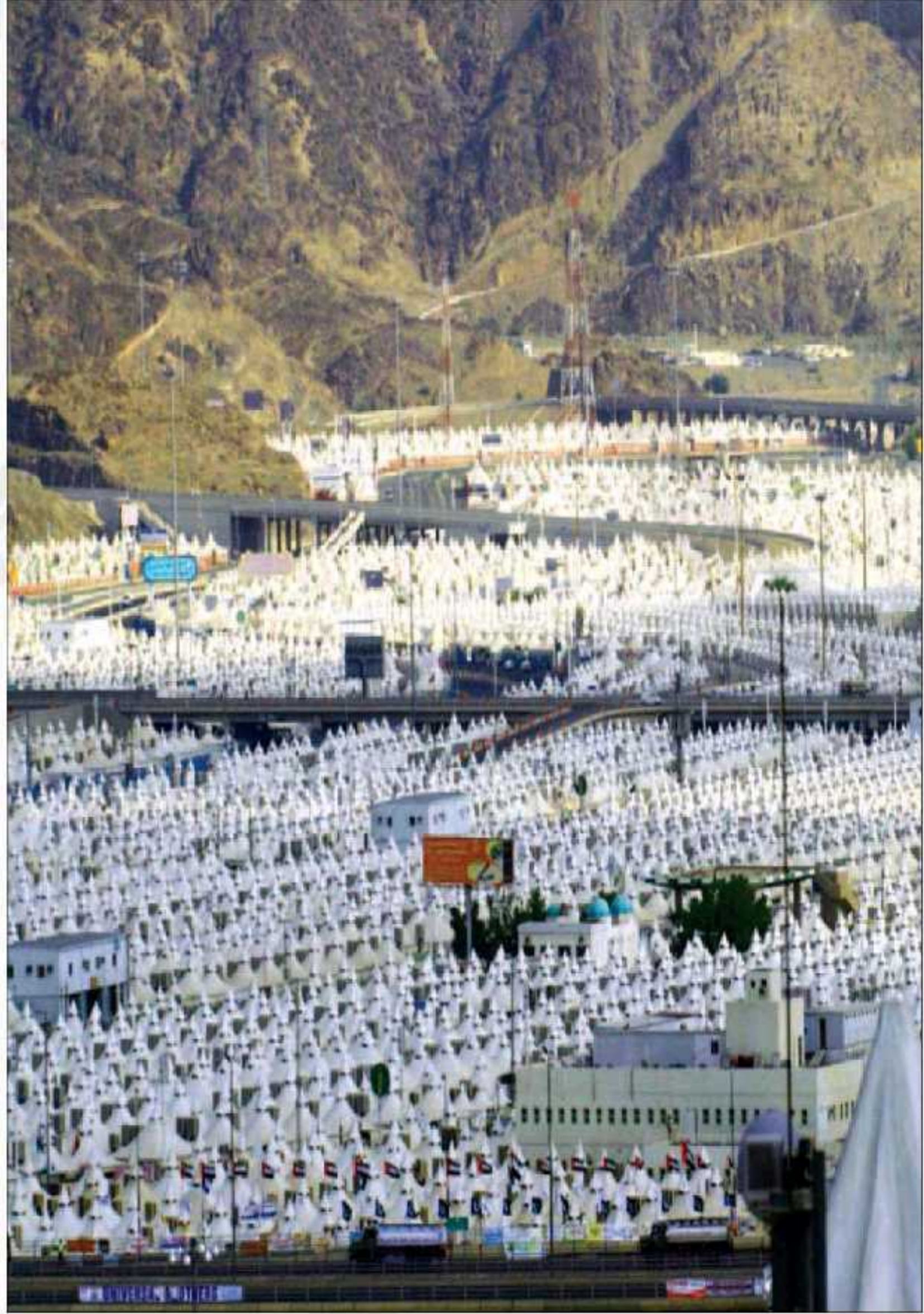
منبنة لحجاج الببضاء، في منى كما بدت أسس (أبدا)