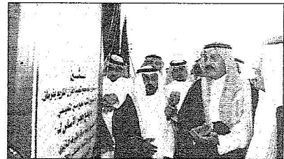
الأمير محمد بن ناصر يمشن مشروعات التعليم