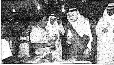
وتعقد لجنة المعرض للمصالح للمهرجان