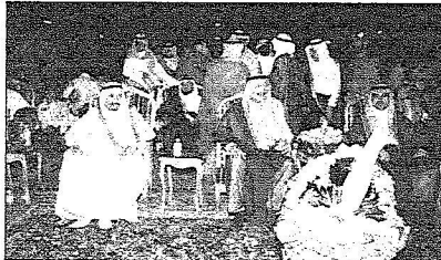
أمير جازان يشراف على حفل أهالي فرسان

جازان - وانتظار الركاب بميناء جازان التابعتين لإدارة الطرق والنقل بالمنطقة واستمع لشرح مفصل من مدير عام إدارة الطرق والنقل بالمنطقة المهندس ناصر بن علي الحازمي عن الخدمات المقدمة للمسافرين بين جازان وفرسان. وكان سموه قد وصل إلى جزيرة فرسان حيث كان في استقباله محافظ فرسان المهندس عبدالرحمن بن عبدالحق ومشائخ أهالي فرسان من جهة أخرى التقى صاحب السمو الملكي الأمير محمد بن ناصر بن عبدالعزيز أمير منطقة جازان مساء أمس الأول مشائخ وأهالي محافظة فرسان. وقد بدأ اللقاء بتلاوة آيات من القرآن الكريم، ثم تلقى عدة رسائل أسامة بن علي صقل كلمة أهالي اعراب فيها عن سعائه وكافة أهالي المحافظة بزيارة سموه للجزيرة وتشدين عدد من المشروعات التنموية ومهرجان الحريد للعام الحالي. بعد ذلك التقى سمو أمير منطقة جازان كلمة عبر في مستهلها عن سعائه بزيارة المحافظة ومشاركة