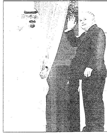
خادم الحرمين والرئيس البولندي يلوحان للصحافيين قبل المباحثات