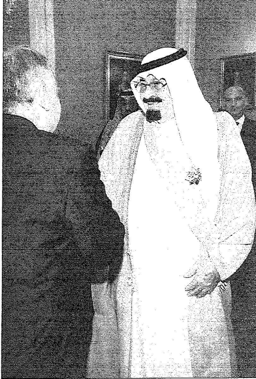
خادم الحرمين والرئيس البولندي ومصافحة حارة بعد تبادل الأوسمة

عبدالعزيز التي تمنح لكبار قادة وزعماء دول العالم. حضر تبادل تقليب الأوسمة صاحب السمو الملكي الأمير سعود الفيصل وزير الخارجية وصاحب السمو الملكي الأمير مقرن بن عبدالعزيز رئيس الاستخبارات العامة وعدد من المسؤولين البولنديين.