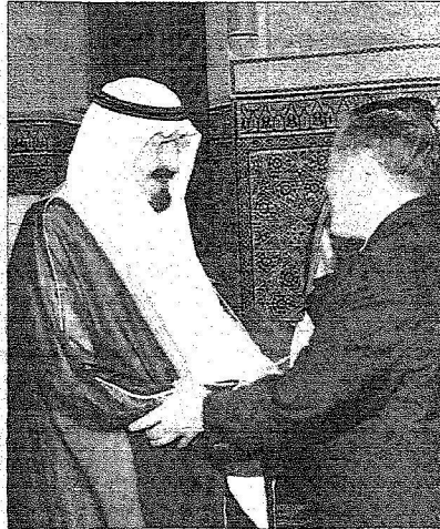
خادم الحرمين لدى استقباله أمس المبعوث الصيني الخاص للقضية الشرق الأوسط. رأس

واقدم بأعمال السفارة الألمانية لدى المملكة الدكتور ددليف وولتر. وتسلم خادم الحرمين الشريفين رسالة من الرئيس هو جين تاو رئيس الصين، وقام بتسليم الرسالة لخادم الحرمين الشريفين المبعوث الصيني الخاص للقضية الشرق الأوسط السفير الصيني لدى المملكة يانغ هونغ لين.