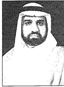
د. عدنان بن محمد بن عبدالعزيز وزان