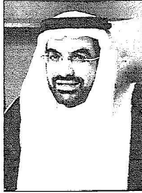
د. خالد بن صالح السلطان