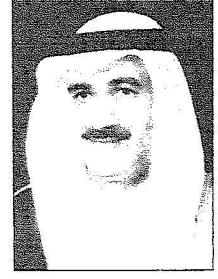
د. عبدالله بن محمد بن تركي رجيحي

الشيخ الشنقيطي رئيساً لـ (الظالم) ود. العلي رئيساً لهيئة الرقابة والتحقيق والخليوي مديراً عاماً للجمارك ود. أبو الخيل مديراً لجامعة الإمام ود. عدنان وزان مديراً لجامعة أم القرى ود. العقلا مديراً للجامعة الإسلامية ود. العثمان مديراً لجامعة الملك سعود