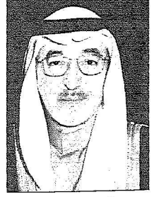
أسامة بن جعفر فقيه