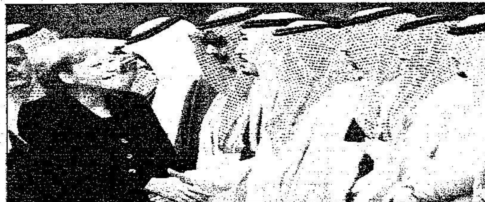
مستشارة جمهورية ألمانيا الاتحادية تصافح أصحاب السمو الأمراء ضمن الوفد المرافق للملك