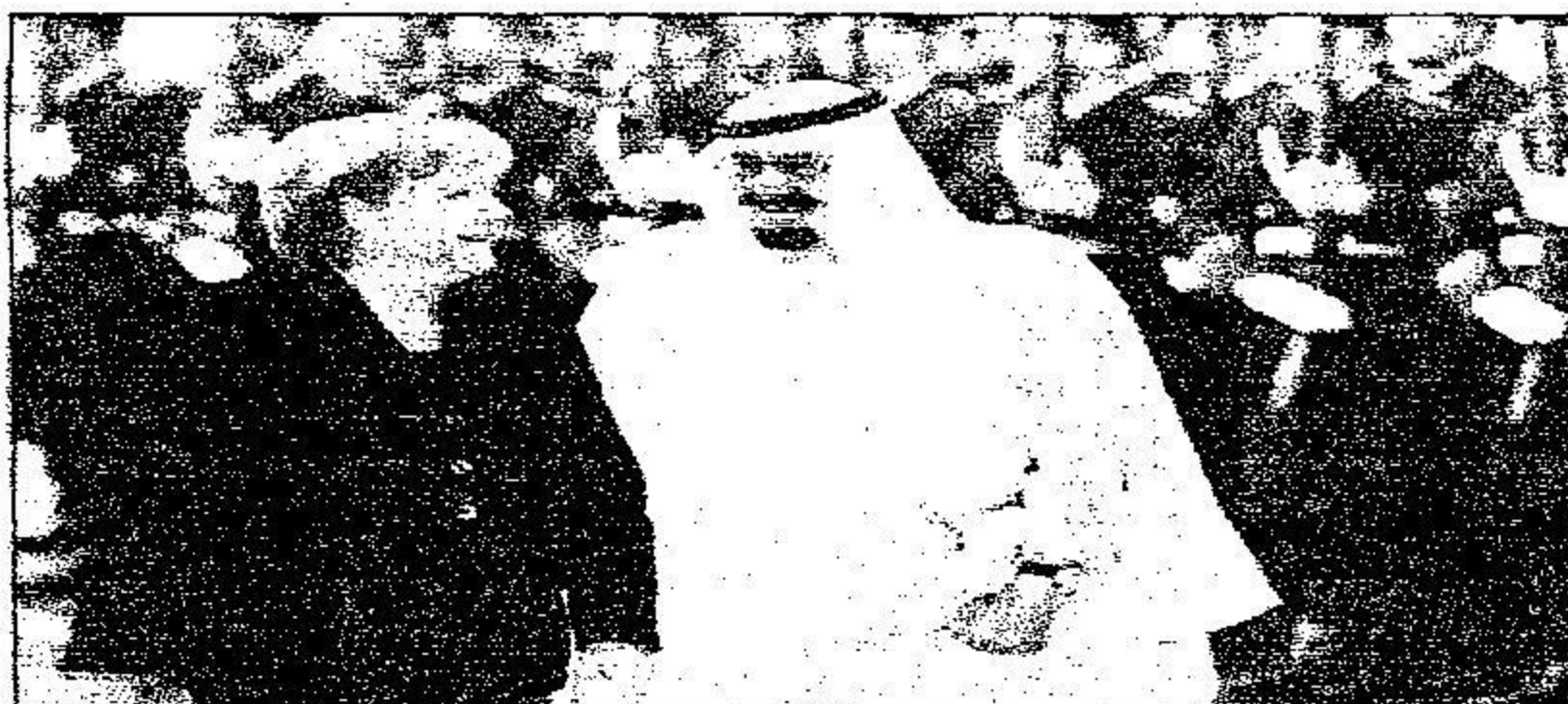
خادم الحرمين وإلى جواره أنجيلا ميركل يستعرض حرس الشرف في المطار

ومعالي مستشار خادم الحرمين الشريفين المشرف على العيادات الملكية الدكتور فهد العبدالجبار ومعالي نائب رئيس الديوان الملكي الأستاذ خالد بن عبدالرحمن العيسى ومعالي سفير خادم الحرمين الشريفين لدى الولايات المتحدة الأمريكية الأستاذ عادل بن أحمد الجبير ومعالي قائد الحرس الملكي الفريق أول حمد بن محمد العوفي ومعالي سفير خادم الحرمين الشريفين لدى ألمانيا الدكتور أسامة بن عبدالمجيد شيكشي، حفظ الله خادم الحرمين الشريفين في سفره وإقامته.