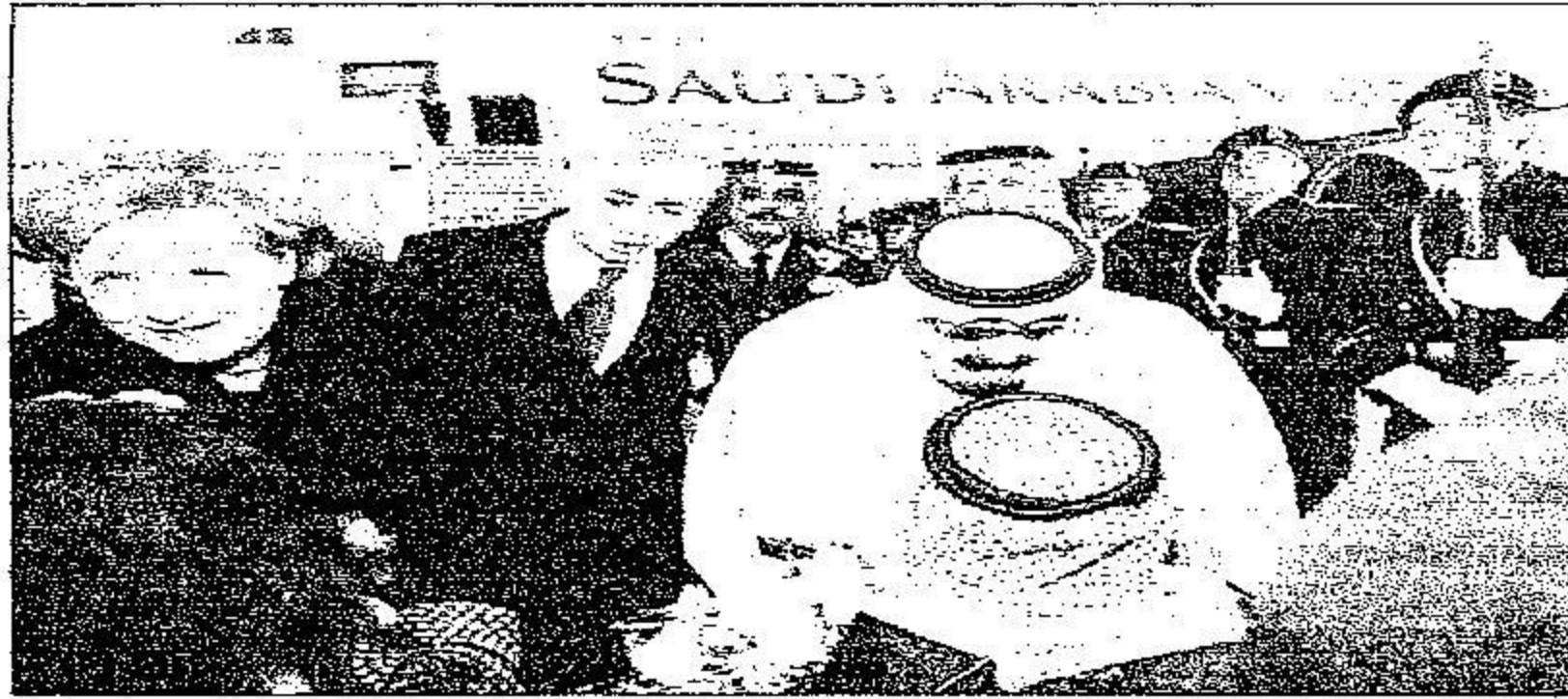
.. ويتسلم باقة ورد من أحد الأطفال خلال الاستقبال