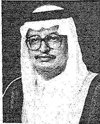
د. سعيد الملص

وأضاف: لقد بارك خادم الحرمين الشريفين في الستينيتين الأخيرتين بعد توليه مقاليد الحكم عددا من القرارات والمشروعات النوعية للتعليم التي سئلمس آثارها على المدى القريب، بعون الله ومن أهمها: توجيهه بإطلاق مشروع الملك عبدالله لتطوير التعليم الذي يشرف عليه شخصيا، حيث وجه بتخصيص ٩ مليارات ريال لهذا المشروع، وذلك انطلاقا من حرصه الشديد -أيده الله- على إصلاح وتطوير التعليم بوصفه بوسلة التقدم الحقيقية التي توجه عجلة النمو في زمن لا يعرف السكون، طبيعة العصر الحديث تتطلب نوعا جديدا من التطوير غير مألوف