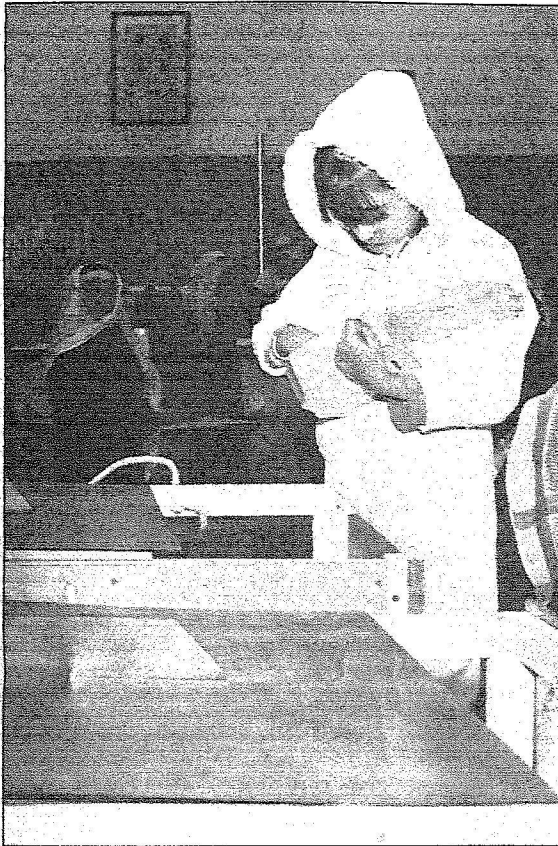
طفلة تتعلم مبادئ مالياً