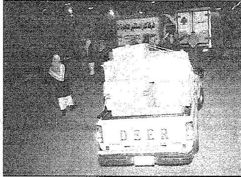
سيارة لمد المواطنين حملة بالتبرعات

الرياض - بندر الناصب - متعب أبو ظهير: